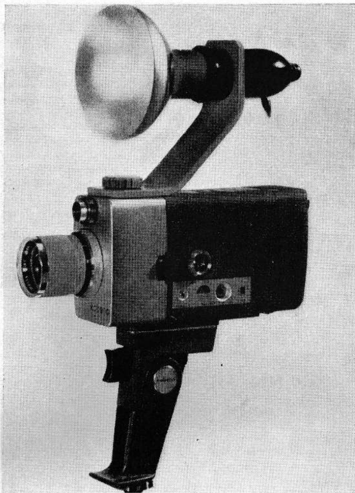
Kobena optageren med påsat filmlampe. Den koster ca. kr. 50,-.

Med Kobena 321 er man gået et skridt videre, idet denne optager er forsynet med et zoom-objektiv fra 10 til 30 mm med lysstyrke 1,8. Den store spejlreflekssøger kan indstilles efter øjets synsstyrke, hvilket er en stor fordel for fotografer, som bruger briller. Den har ligesom model 121 det udmærkede pistolgreb, som ligger godt i hånden. Filmilægningen sker på samme måde, og med model 321 har man altså også mulighed for at zoome manuelt. Ved denne operation må vi anbefale at bruge stativ eller i hvert fald støtte for at undgå rystelser under optagelsen. Zoom-objektivet er nu